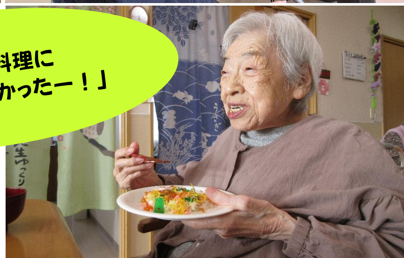
おめでとう ございます