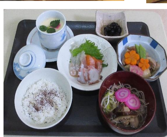
大晦日 年越し御膳