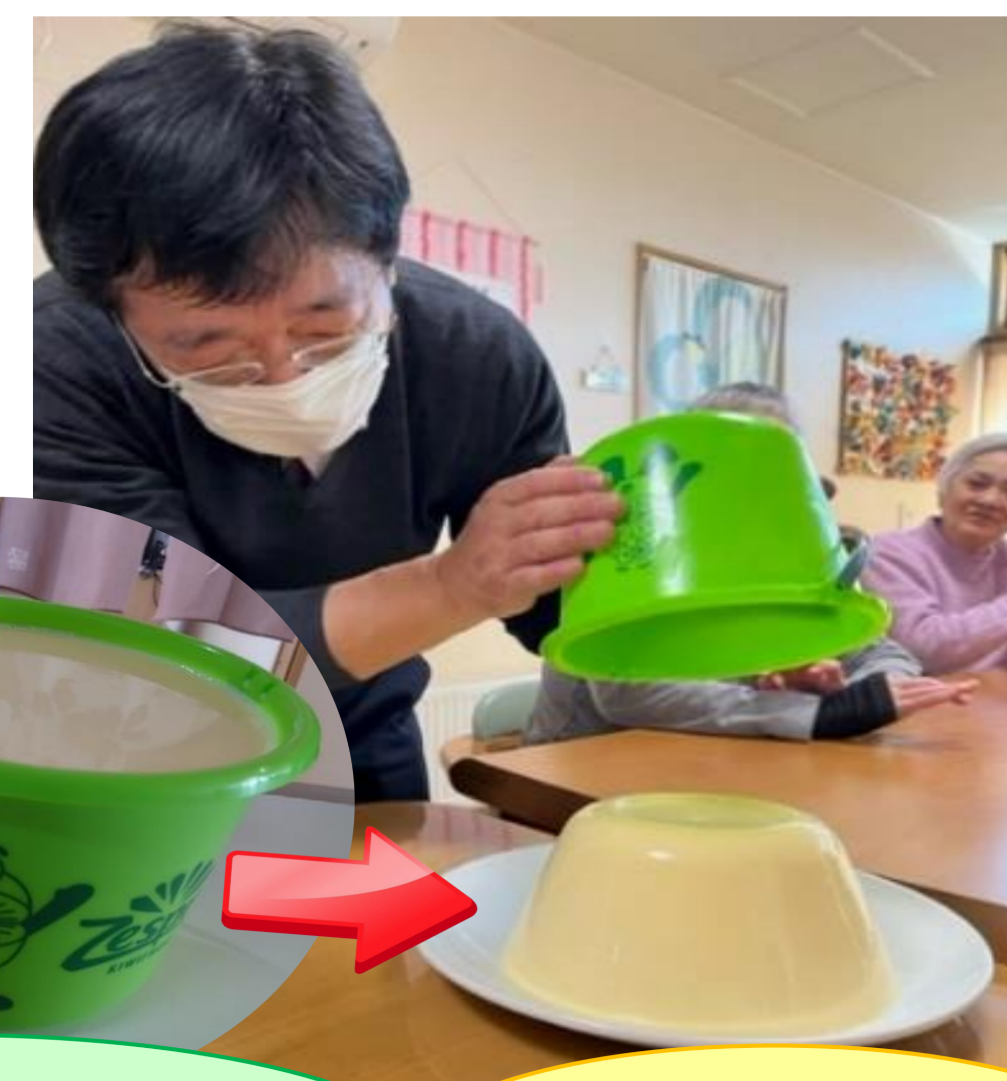
しっかり冷やして