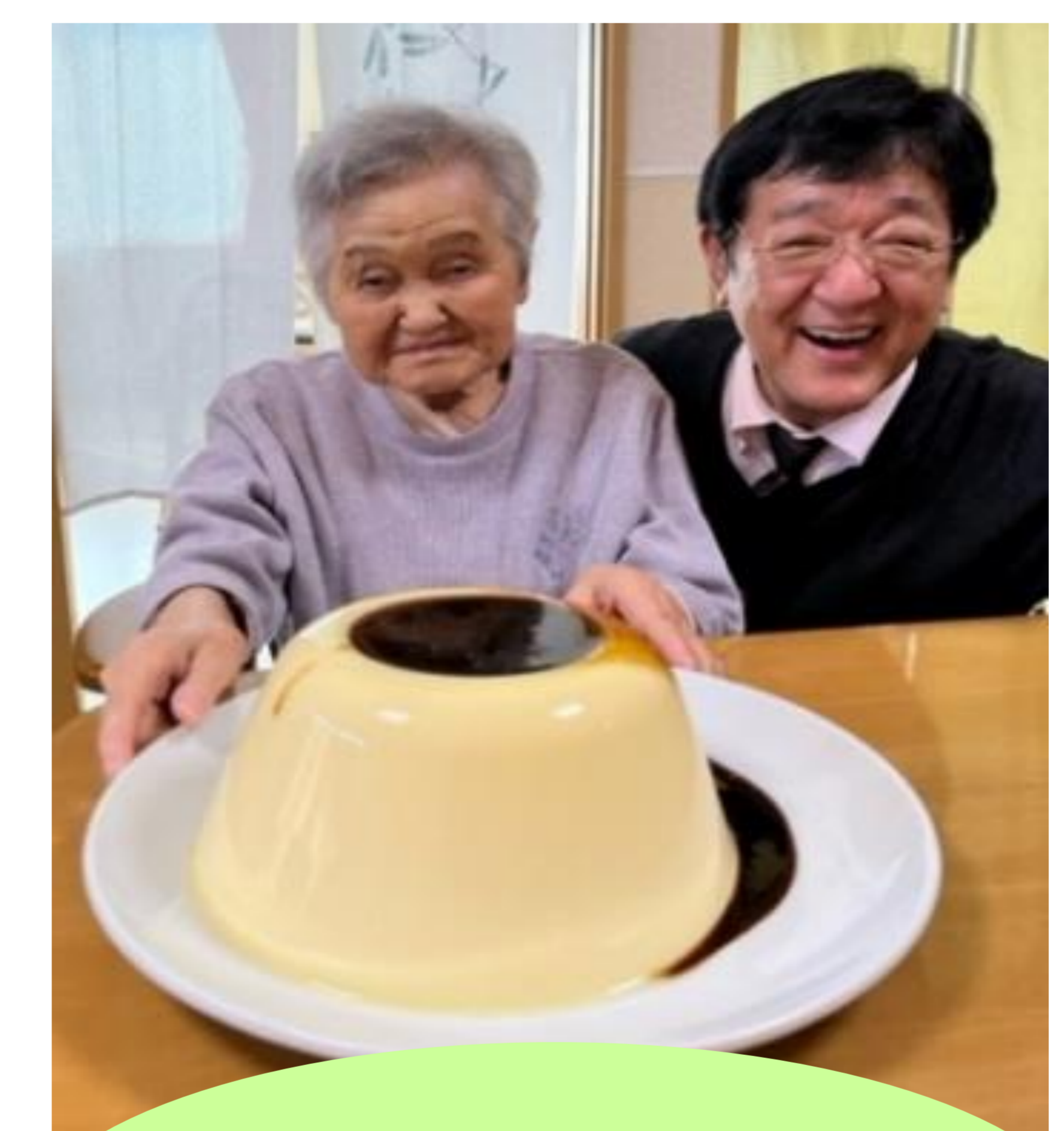
私の顔 隠れちゃうよ！