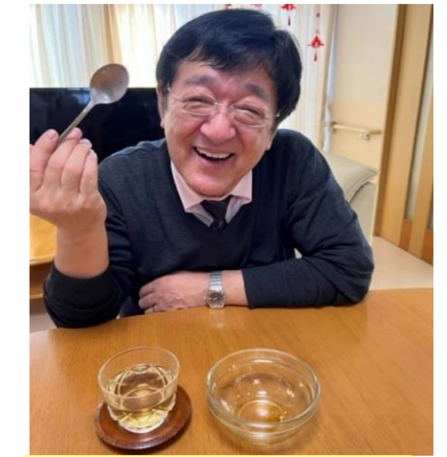
上手に出来ました