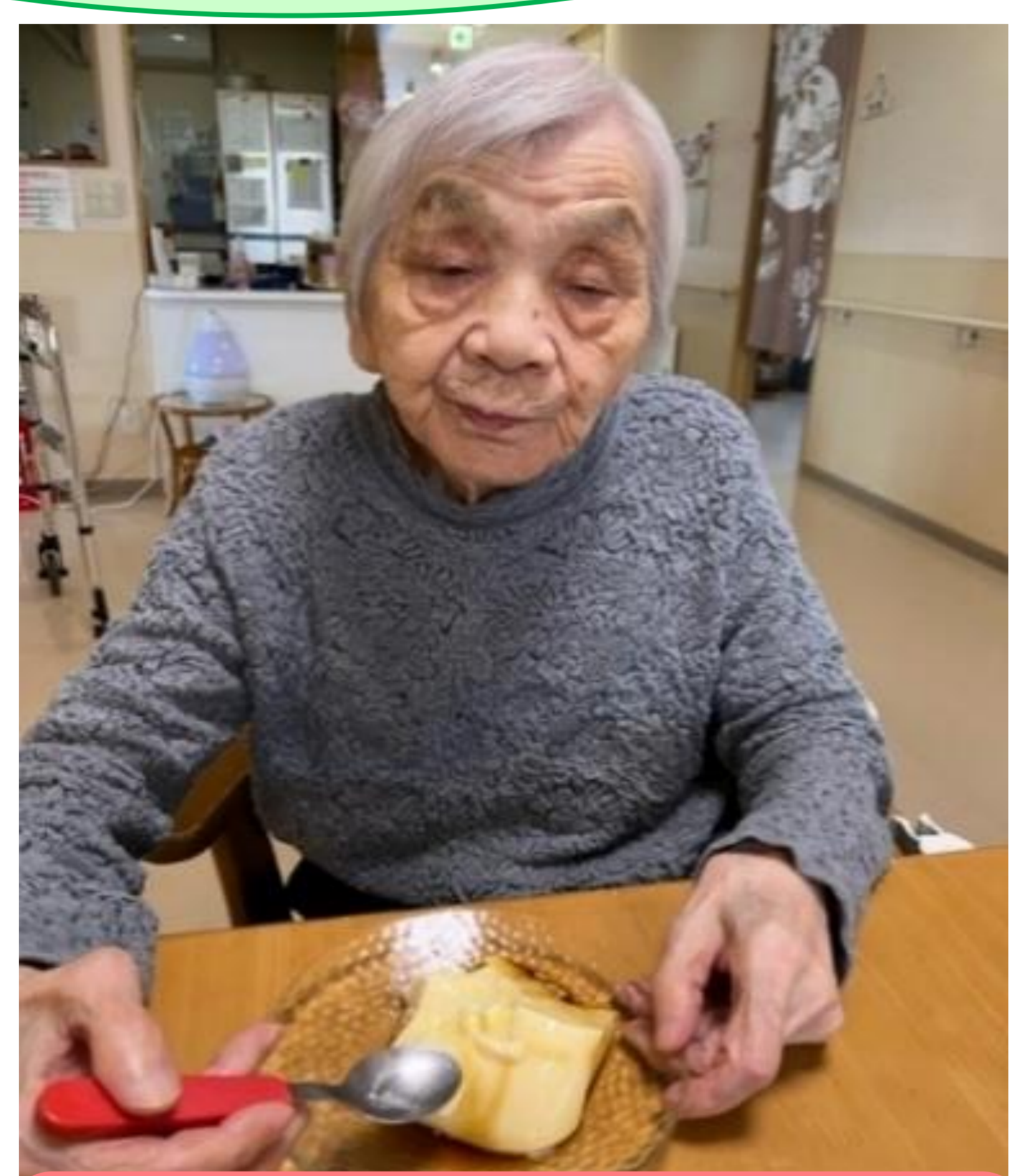
美味しくできたね